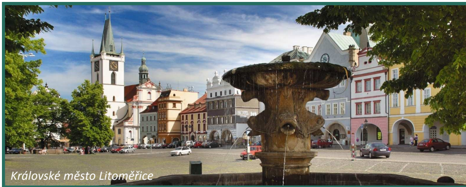
Královské město Litoměřice